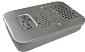
KIN.0481 - SILICA BOX